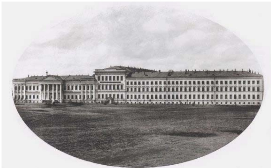
Здание Омского кадетского корпуса. Фотография И. Е. Кесслера. 1880-е годы

от претерпленных трудностей и опасностей и собраться с силами для новых подвигов. Опасности для удалого казака, конечно, нипочем; без них он бы совершенно стосковался в своем уединении, вдали от семейства и родственников. В особенности зимою степная жизнь делается, по-видимому, несносною своим однообразием. Беспредельная снежная пустыня вокруг одинокого жилья; бураны, не позволяющие показать носу за дверь; вой голодных волков да изредка какой-нибудь проезжий по собственной или казенной надобности – вот все, что напоминает об остальном мире этим затворникам» 5 .